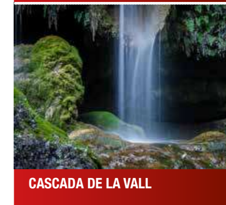
CASCADA DE LA VALL