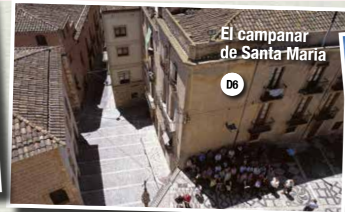
El campanar de Santa Maria