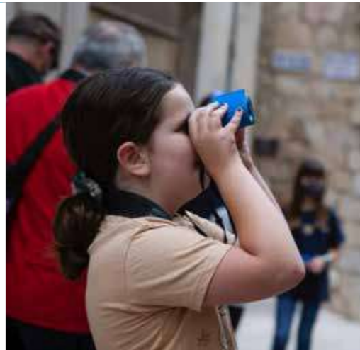
VISITA GUIADA FAMILIAR