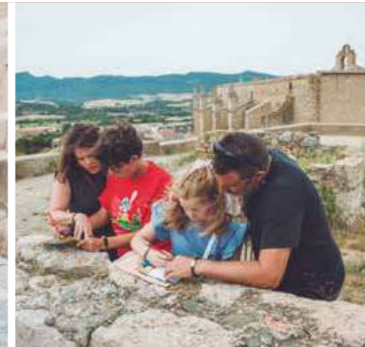
VISITA AUTOGUIADA FAMILIAR

Descobreix la persona impostora de Montblanc