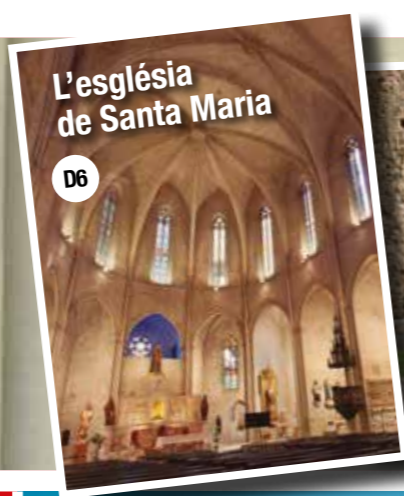
L'església de Santa Maria

Descobreix-nos Montblanc compartint les teves millors fotos amb les etiquetes #montblancmedieval, #respiramontblanc i #vilaambcaràcter