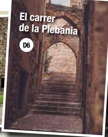
El carrer de la Plebania