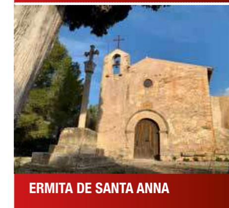
ERMITA DE SANTA ANNA