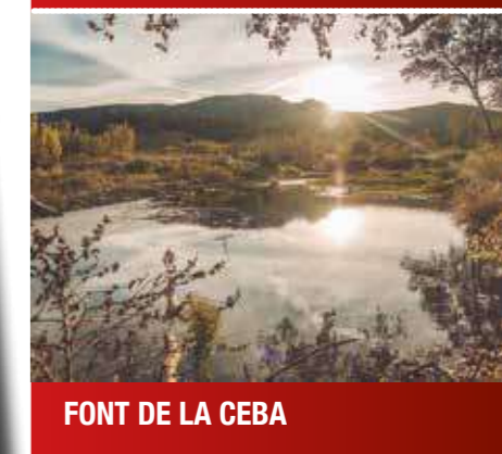
FONT DE LA CEBÀ