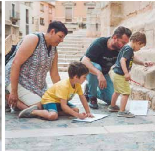
VISITA AUTOGUIADA FAMILIAR