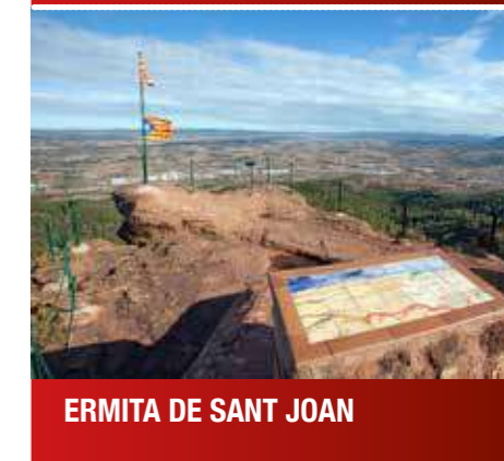
ERMITA DE SANT JOAN