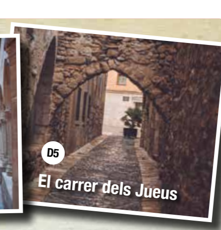
El carrer dels Jueus