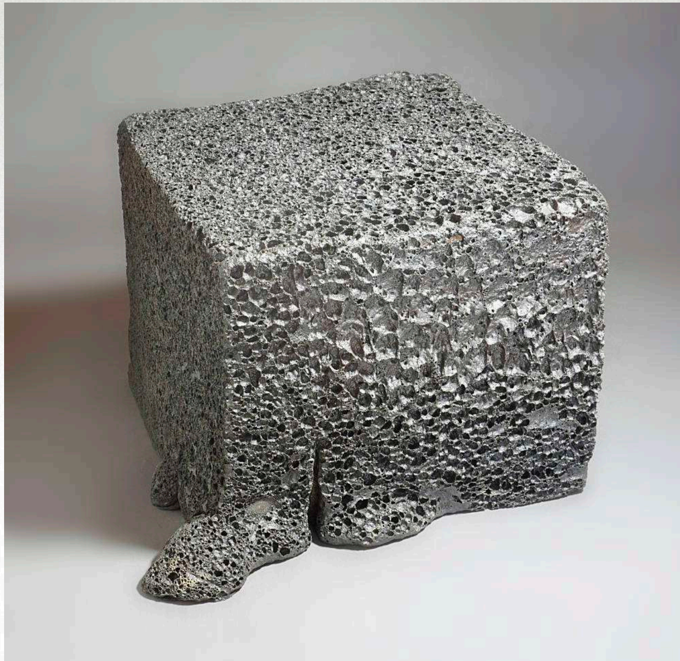
30 x 36 x 35 cm