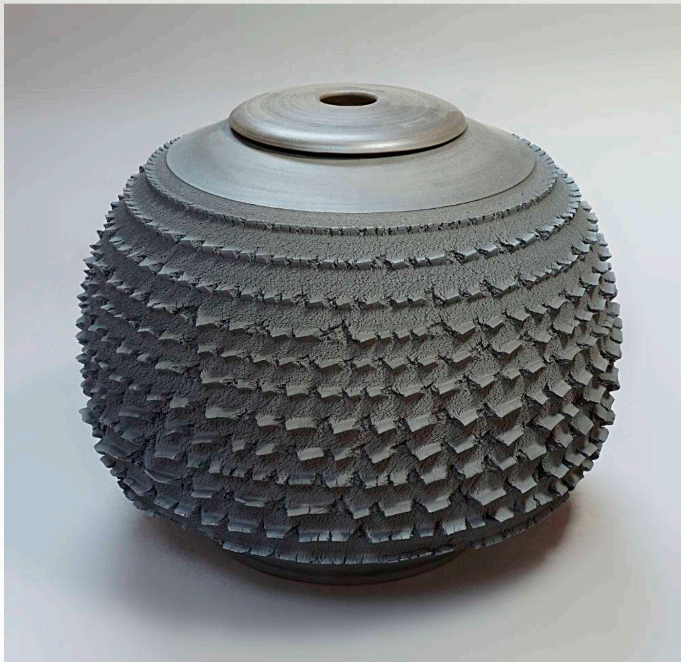
25 x 23 cm