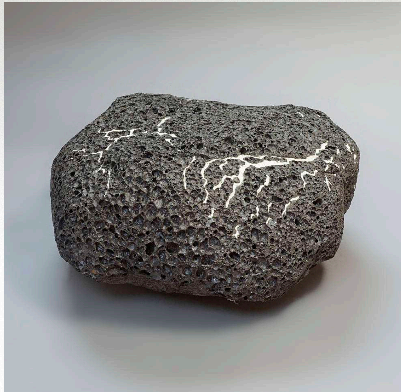
32 x 30 x 17 cm