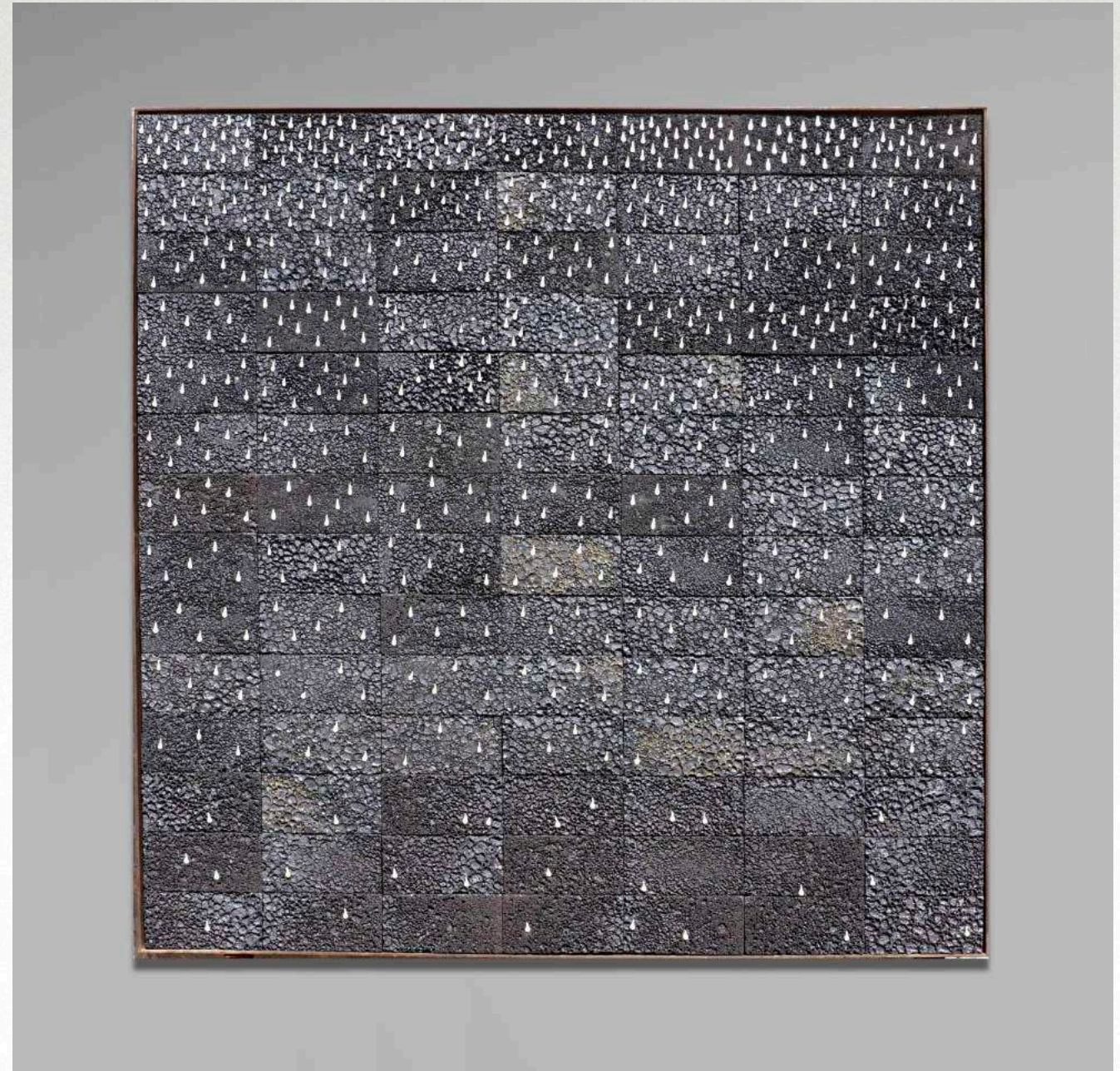
147 x 147 cm