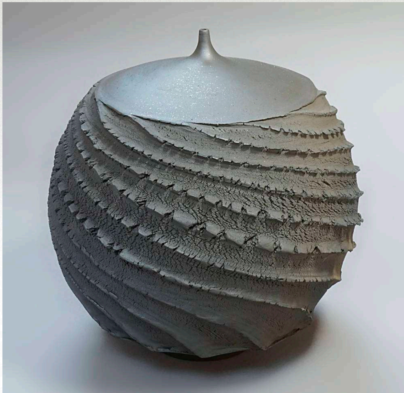
25 x 24 cm