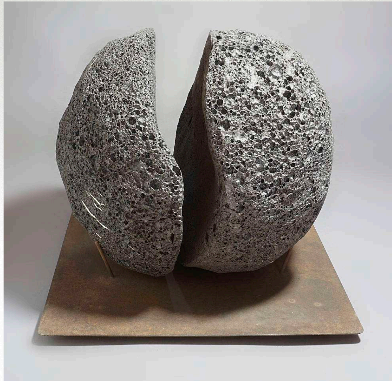
38 x 38 x 34 cm