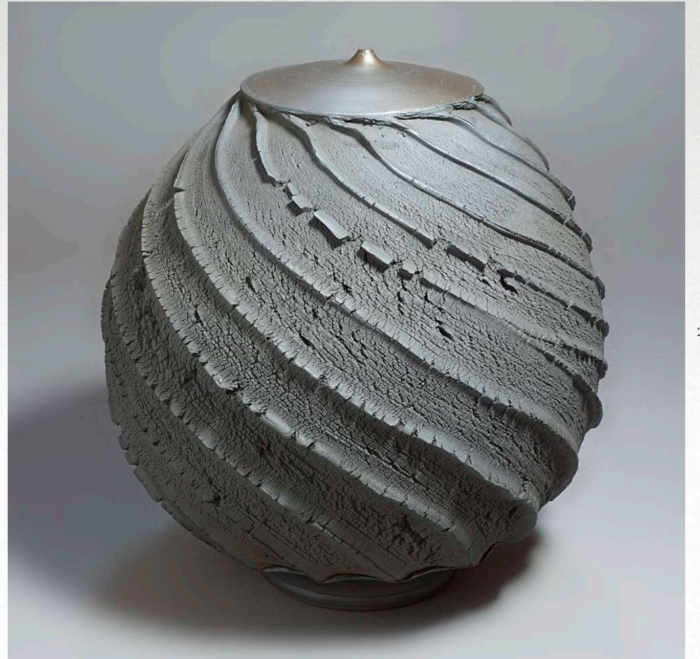
30 x 26 cm