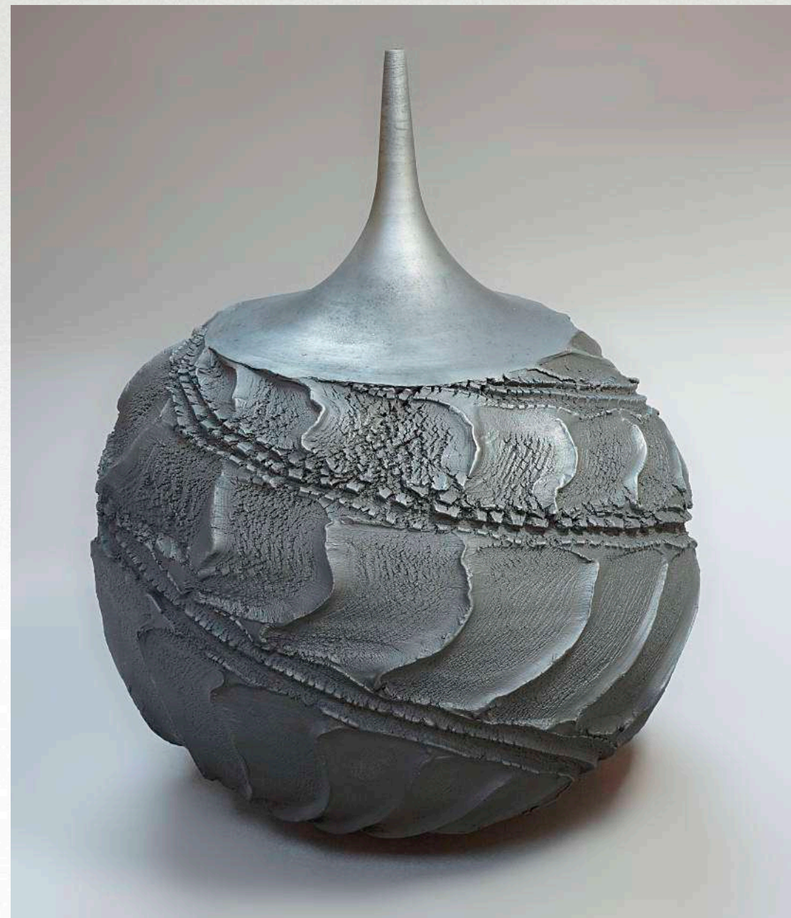
37 x 26 cm