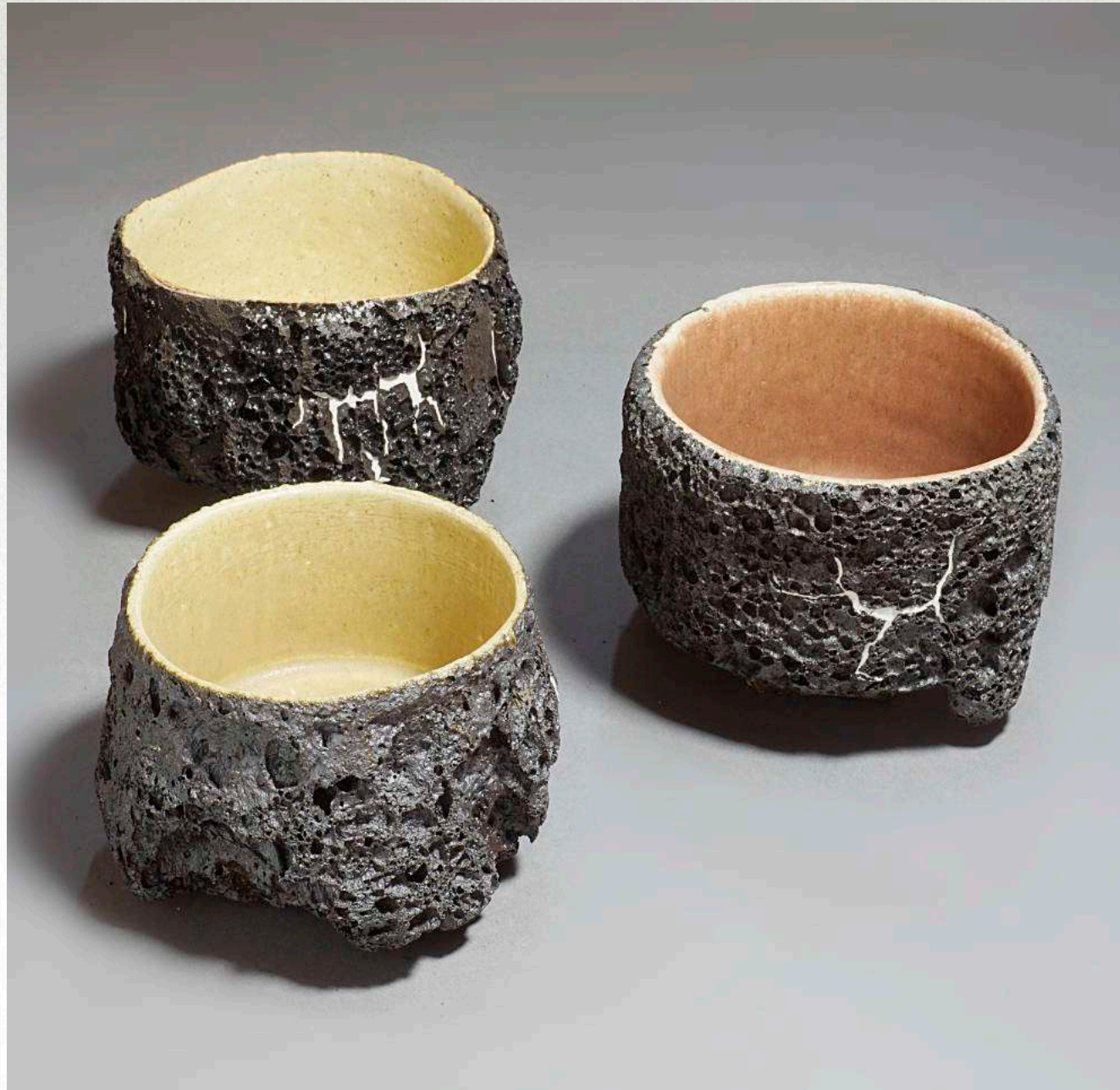
10 x 12 cm/unitat